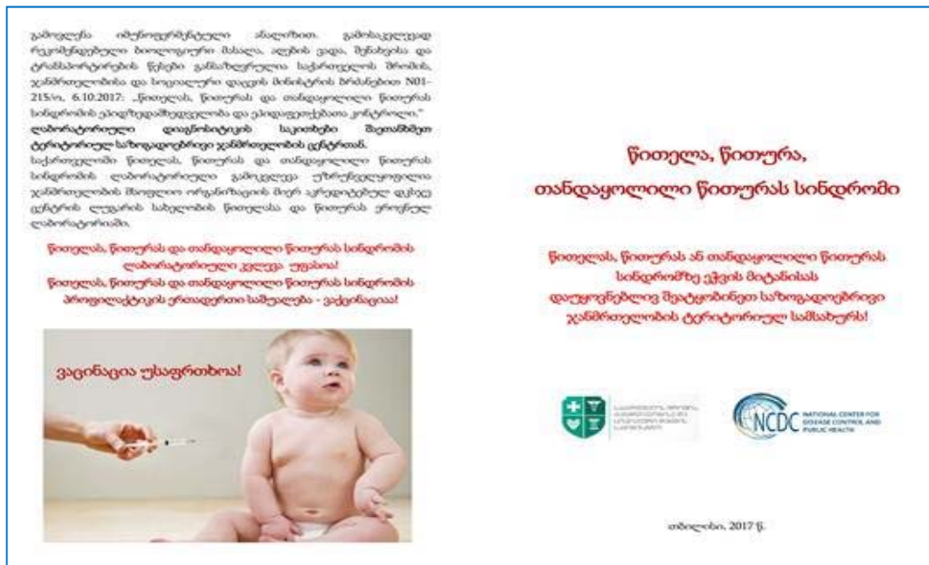
* წითელას, წითურას, თანდაყოლილი წითურას სინდრომის ბროშურა