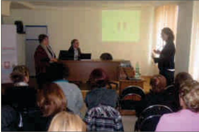
ონკოლოგიის კურსი პირველადი ჯანდაცვის (სოფლის) ექიმებისა და ექთნებისთვის